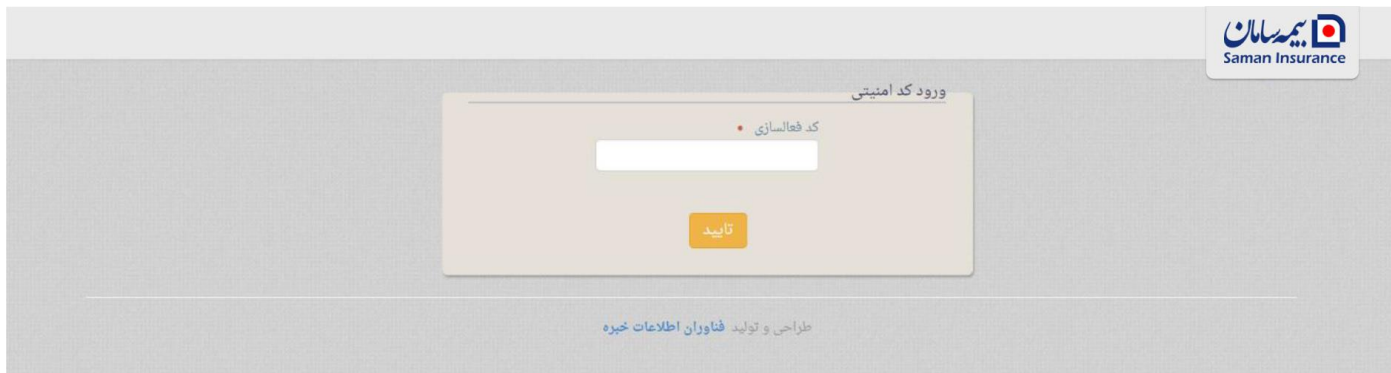
تصوير ۲- ورود کد امنيتي

با ورود اين کد فعالسازي در کادر مرتبط، وارد صفحه مورد نظر خواهيد شد و مي توانيد ادامه عمليات مورد نظر خود را انجام دهيد. (تصوير ۲)